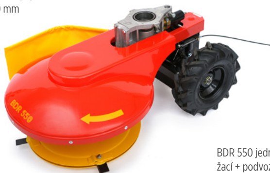
BDR 550 jednobubnové žací + podvozek

Pro pohonné jednotky s odstředivou spojkou Ø 80 / 120 mm