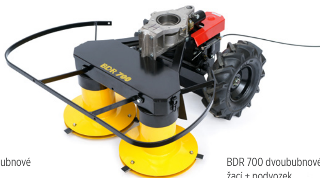
BDR 700 dvoububnové žací + podvozek